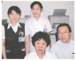
医療連携室スタッフ

主な役割は、かかりつけ医からの外来紹介の事前受付や、入院退院の際における患者さまのサポートです。